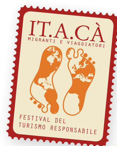
Illustrazione di Giulia Gardelli